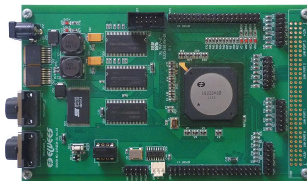
Отладочный модуль MC-24R2EM-3U